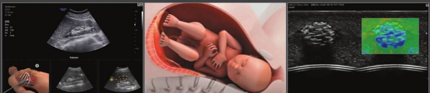
Почка в режиме EzAssist™

Полуавтоматическая функция, быстро и точно измеряющая толщину воротникового пространства плода.