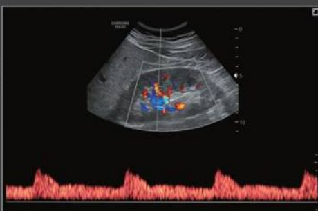
Почка, триплексный режим